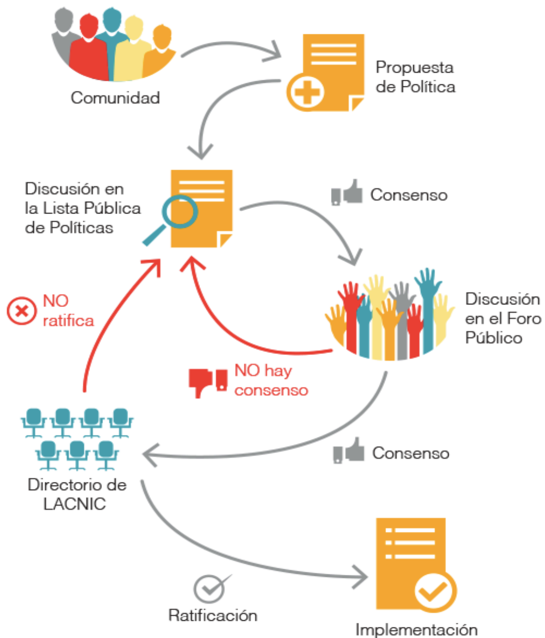
Diagrama del Proceso Normal de Desarrollo de Políticas